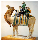
唐三彩駱駝載舞俑